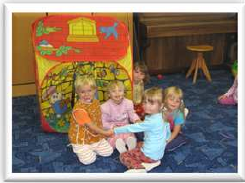
v makové panence