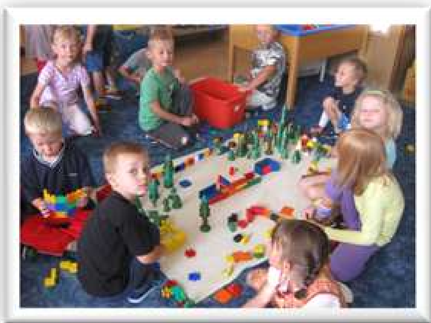
v křemítku a v krtečkovi